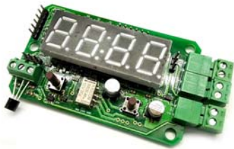
Рис. 1 Общий вид устройства.

Предлагаемый блок в собранном виде позволяет реализовать принцип: купил – подключил. Блок позволит радиолюбителю получить простой и надежный цифровой термостат с возможностью измерения и контроля температуры в диапазоне -55°С до +125°С. Устройство будет полезно для применения в быту, дома, на даче, бане или погребе. С его помощью можно производить измерения температуры окружающей среды, контролировать и регулировать рабочую температуру электрических котлов, теплого пола, теплиц, холодильных установок или морозильных камер. Устройство запоминает настройки гистерезиса при отключении питания.