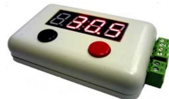
Рис. 4 Вариант оформления устройства.

Подключение модуля MP220ор на 220В, для управления мощной нагрузкой до 4 кВт (приобретается отдельно)