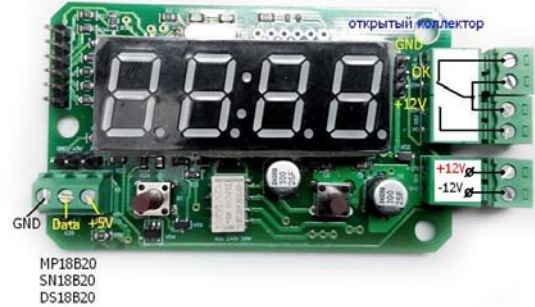
Рис. 2 Назначение разъемов.

что приводит к завышенным показаниям. Поэтому для точных показаний термостата, необходимо вынести термодатчик за пределы корпуса устройства. Для индикации состояния реле задействована разделительная точка. При включении реле она начинает мигать с частотой 1 Гц. В устройстве реализовано снижение яркости дисплея. Для переключения в данный режим необходимо удерживать правую кнопку при подаче питания. Для возврата к настройке по умолчанию необходимо сделать сброс. Для сброса устройства удерживая левую кнопку, подайте питание. Перед началом эксплуатации необходимо сделать сброс!