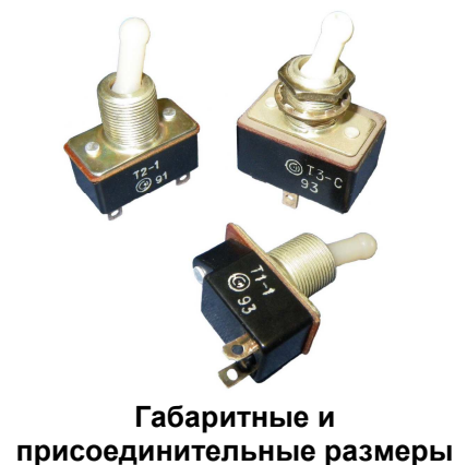
Габаритные и присоединительные размеры

Тумблеры Т3-А и Т3-СА изготавливаются только с приемкой «СКК». Климатическое исполнение УХЛ. Тумблеры Т3, Т3-С, Т3-А и Т3-СА изготавливаются в пожаробезопасном исполнении.