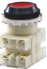
2з+2р, IP40 красный