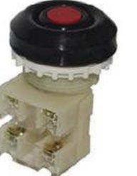
1з+1р, IP54 красный