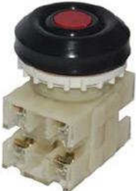
2з+2р, IP54 красный