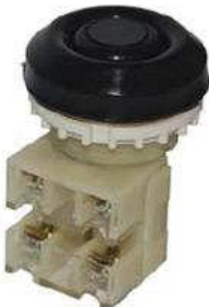
1з+1р, IP54 черный