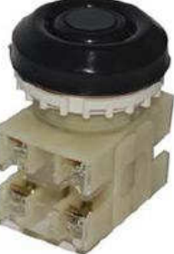
2з+2р, IP54 черный