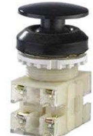
2з+2р, IP54, гриб, черный