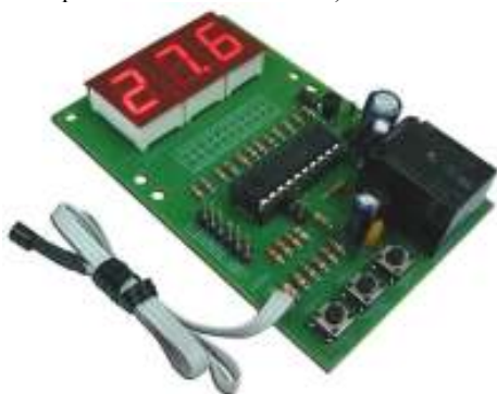
Рис.1. Общий вид изделия

Цифровой контроллер температуры предназначен для измерения температуры, а также ее регулирования с помощью исполнительных устройств (вентилятор и т. д.). Внешние исполнительные устройства будут включены (либо выключены), когда температура окружающего воздуха станет больше (либо меньше) заранее заданных нижнего и верхнего пороговых значений температуры (записываются во внутреннюю энергонезависимую память и поэтому сохраняются при выключении питания).